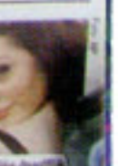
Uppträdde för första gången