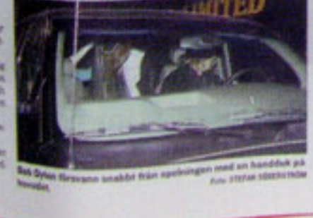
Bob Dylan försvann snabbt från spelningen med en handduk på huvudet.