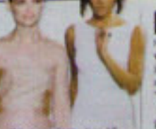
Bästa polare.